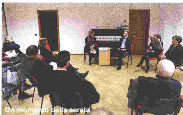
Un momento della serata