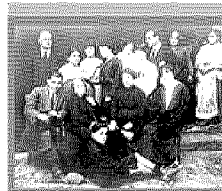
Gabriele d'Annunzio e la famiglia d'origine